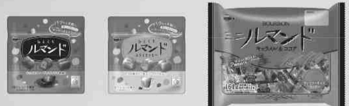
ひとくちルマンド ひとくちルマンド エチオピアモカ ミニルマンドFS キャラメル&amp;ココア