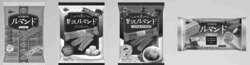
ルマンド 贅沢ルマンド 贅沢ルマンド エチオピアモカ ルマンドアイス