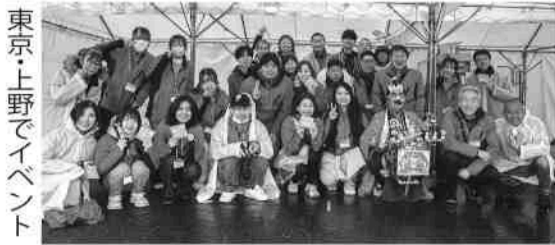
東京・上野でイベント