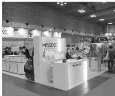
(右)レオン自動機、前田商店 (左)マスタックマシナリ、飯田製作所