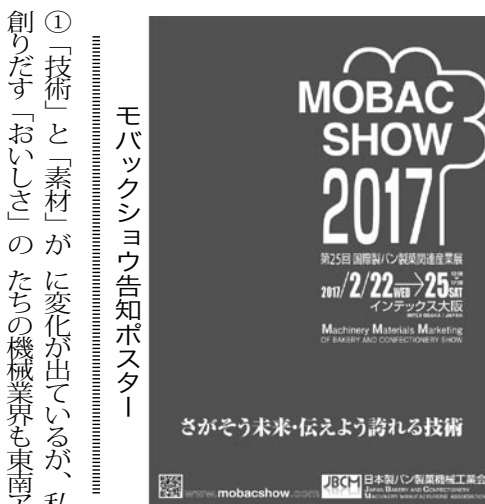
モバックスショウ告知ポスター

4日間、大阪市住之江区のインテックス大阪1・2・3・4・5(A・Bゾーン)号館(計5会場)で実施する。今回は、製パン・製菓に