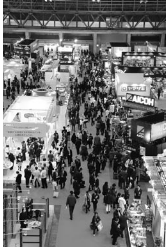
前回の会場の様子

2017モバックスショウ(第25回国際製パン展)は、2017年2月22日(水)から2月25日(土)までの4日間、大阪市住之江区のインテックス大阪1・2・3・4・5(A・Bゾーン)号館(計5会場)で実施する。今回は、製パン・製菓に